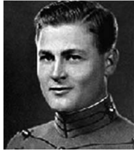
Edward Aloysius Murphy

Stalo sa to v roku 1949 na Edwardsovej leteckej základni Muroc v Kalifornii počas leteckého výskumného projektu MX 981 pod vedením plukovníka J. P. Stappa... Práce zabezpečovala letecká firma Northrop ... Ja som