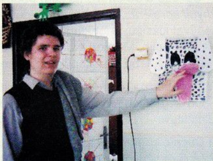
Deti si samy zhotovili karnevalové masky.